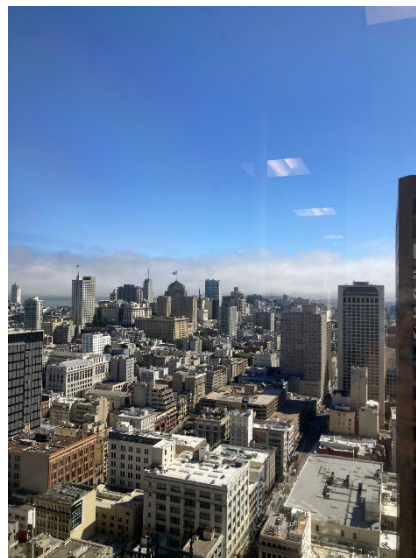
San Francisco オフィスからの眺め